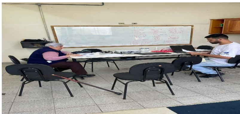
Atividade: reunião de equipe técnica Realizado: 29/07/22

Também aconteceu, neste mês de junho, dia 10, a Visita de Monitoramento da parceria, conforme foto exposta abaixo