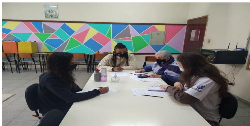
Atividade: parada técnica Realizado: 13/07/22